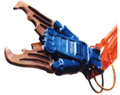
オカダイオン TS-Wクラッシャー