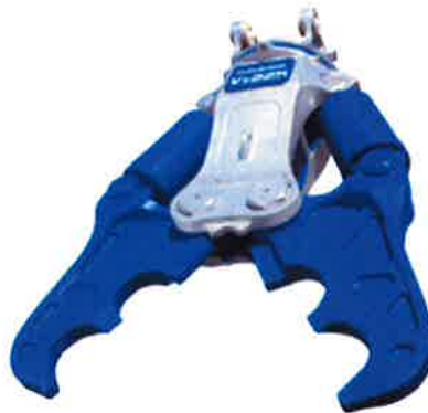
古河ロックドリル Vx225