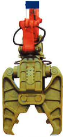
日立建機 HSCシリーズ