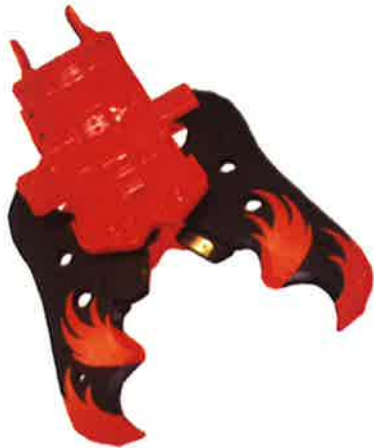
日本ニューマチック工業 圧碎機Sシリーズ